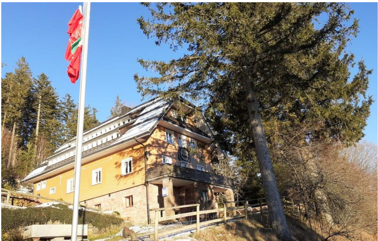
Naturfreundehaus „Badener Höhe“, von 1935 – 1945 Wanderheim der Ortsgruppe Baden-Baden

1935 Das Wanderheim der „Naturfreunde“ zwischen Sand und Herrenwieser Sattel wird der Ortsgruppe vom Reichstreuhänder zum Erwerb angeboten. Die Naturfreunde-Organisation war direkt nach der Machtergreifung verboten und ihr Vermögen und ihre Liegenschaften konfisziert worden. So auch das Haus am Sand. Der Kauf kommt zustande. Es werden Ein- und Neubauten notwendig.